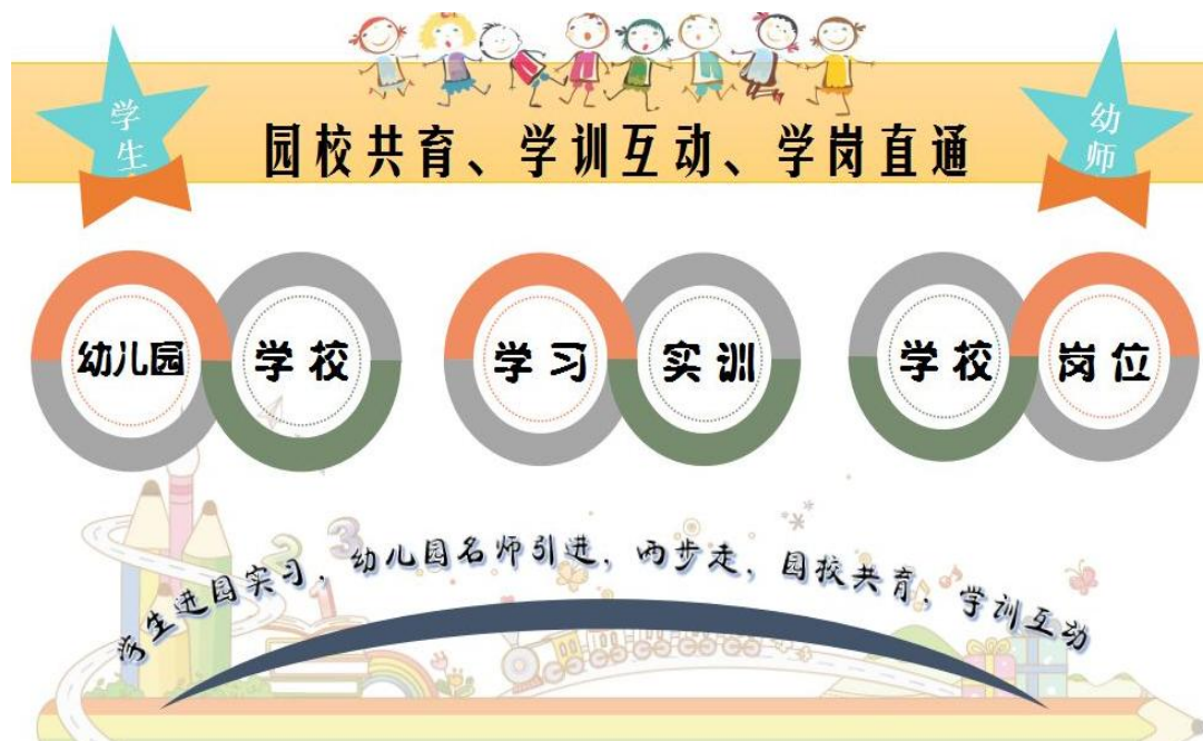
图 9-1 学前教育专业人才培养模式结构图

第六学期，为顶岗实习阶段。实行专兼职双导师制度，指导学生独立带班，将专业素质、职业资格标准和岗位技能融为一体，使学生具备较扎实的保育和教育能力。