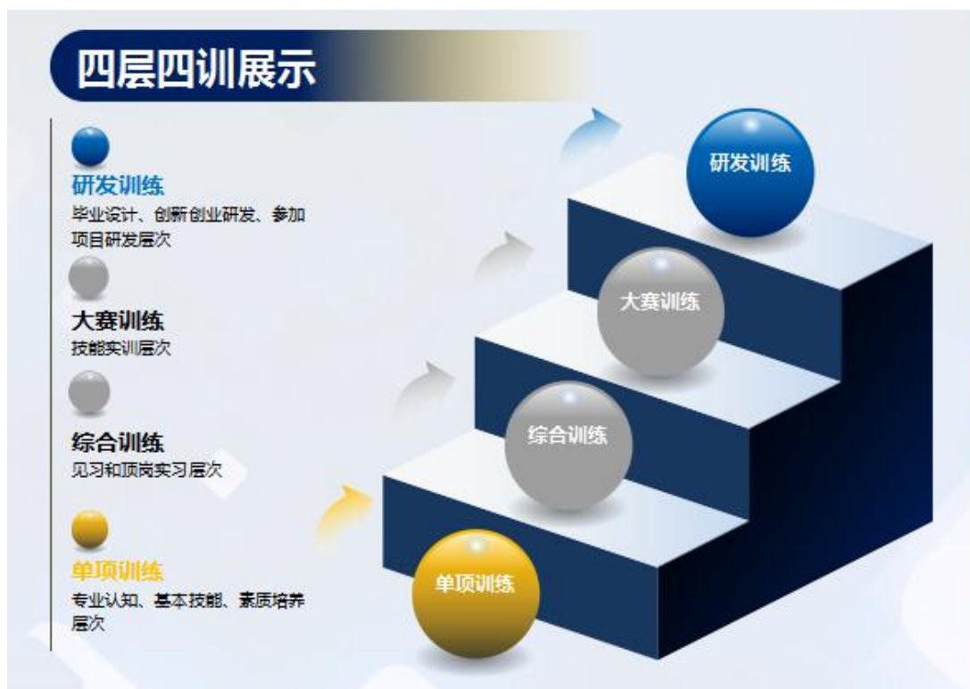
图 11-1 “4 层 4 训”实践教学体系